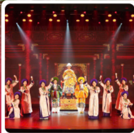
The Heritage Show