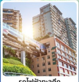
รถไฟฟ้าทะลุถ้ำ

• ไฮไลท์ อุทยานแห่งชาติหลุมฟ้า 3 สะพานสวรรค์ มรดกโลก ระดับ 5 A ชมไฟยามค่ำคืนของสถาปัตยกรรมจีนโบราณ หงหยาดง