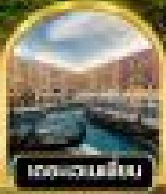
ทะเลสาบมอริส