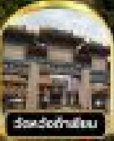
วัดเจ้าฟ้าทิพย์