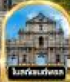
โบสถ์แม่เจ้าโพสพ