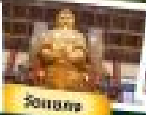
วัดเชียงรุ่ง