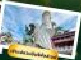
วัดพระเมรุมาศ