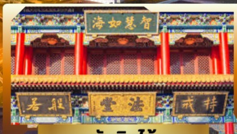
วัดจีนไท่