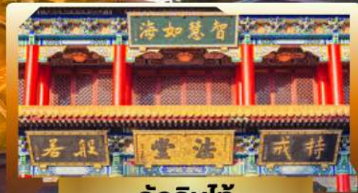
วัดจิ้นไถ่