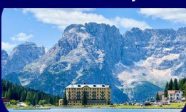
อุทยานฯ โดโลไมท์