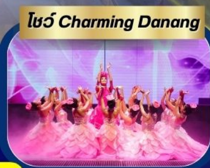
โชว์ Charming Danang