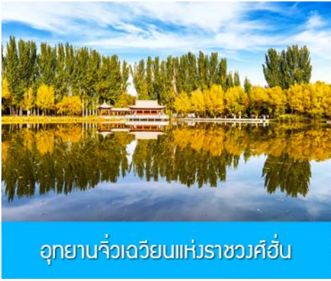
อุทยานจิ๋วเวเวียนแห่งราชวงศ์ฮั่น