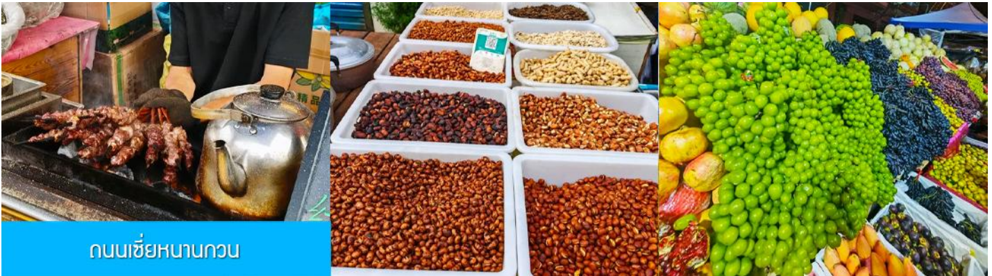
ถนนเซี่ยหนานกวน

หลังอาหารนำท่านเดินทางโดยรถบัสสู่ เมืองซีหนิง 西宁 (ระยะทาง 289 กม. ใช้เวลาเดินทางราว 3 ชั่วโมงเศษ)