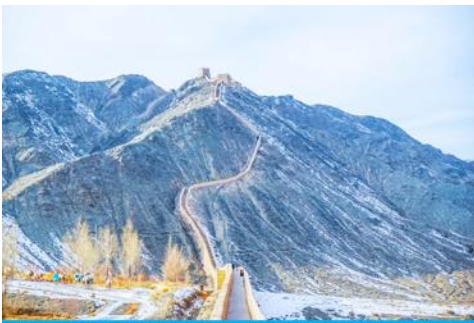
กำแพงเมืองจีนเสวียนปี้