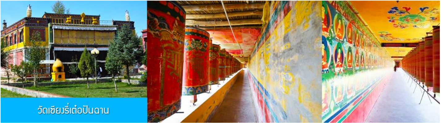
วัดเซียงรีต้อป็นฉาน