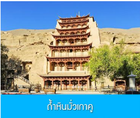
ถ้ำหินมั่วเกาถู

เช้า รับประทานอาหารเช้า ณ ห้องอาหารของโรงแรม (9)