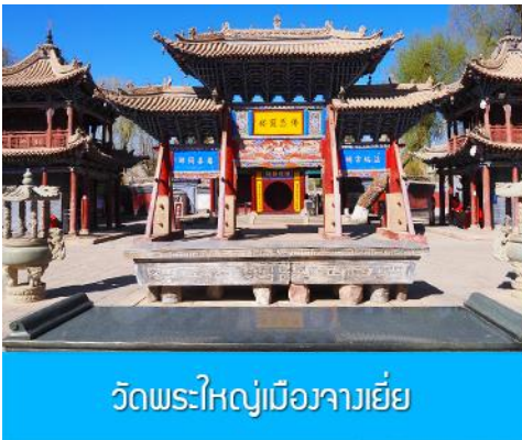
วัดพระใหญ่เมืองจางเยี่ย

เช้า รับประทานอาหารเช้า ณ ห้องอาหารของโรงแรม (15)