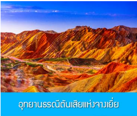
อุทยานธรณีดินสีแห่งจางเยี่ย

หลังอาหารนำท่านเดินทางสู่เมืองจางเยี่ย 张掖 (เดินทางไกลระยะทาง 205 กิโลเมตรใช้เวลาประมาณ 2 ชั่วโมง ครึ่ง)