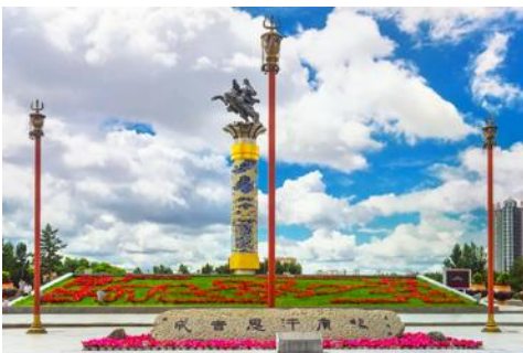
จัตุรัสเวงกิสข่าน

หลังอาหารนำท่านเดินทางสู่เมือง ไห่ลาเอ๋อ 海拉尔市 (ระยะทาง 456 กม. ใช้เวลาเดินทางราว 5 ชั่วโมงครึ่ง)