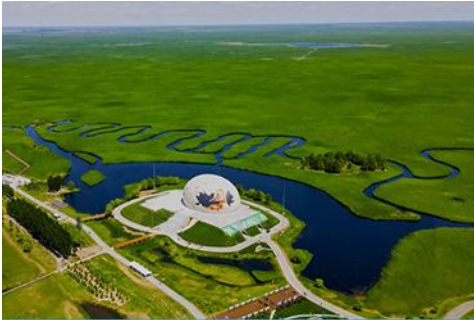
อุทยานชุ่มชื้นจาหลง

รับประทานอาหารเช้า ณ ห้องอาหารของโรงแรม (7)