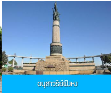
อนุสาวรีย์ฟิงหวง