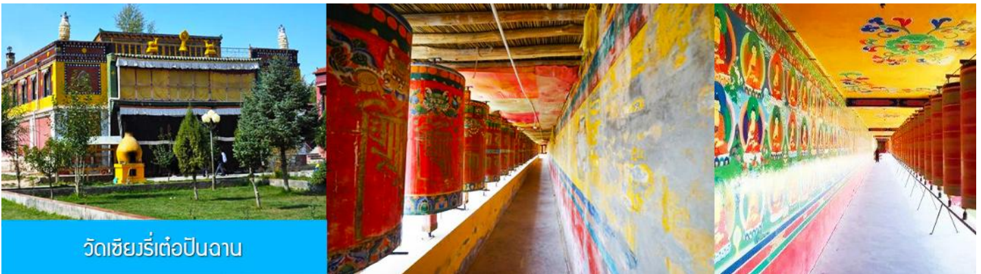
วัดเซียงรีเต๋อปิ่นฉาน