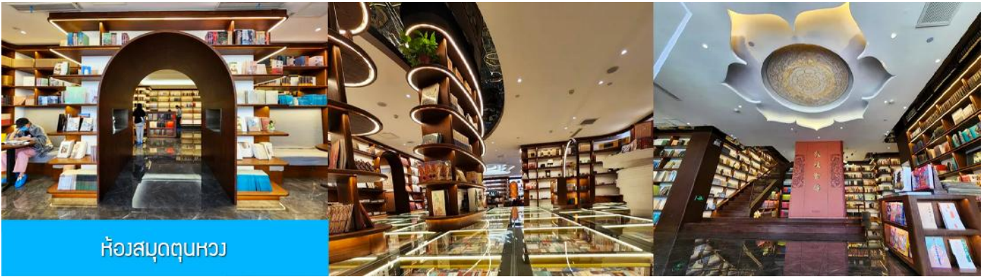
ห้องสมุดตุนหวง