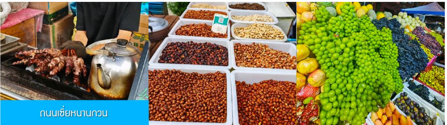
ถนนเซี่ยหนานกวน

หลังอาหารนำท่านเดินทางโดยรถบัสสู่ เมืองซีหนิง 西宁 (ระยะทาง 289 กม. ใช้เวลาเดินทางราว 3 ชั่วโมงเศษ)