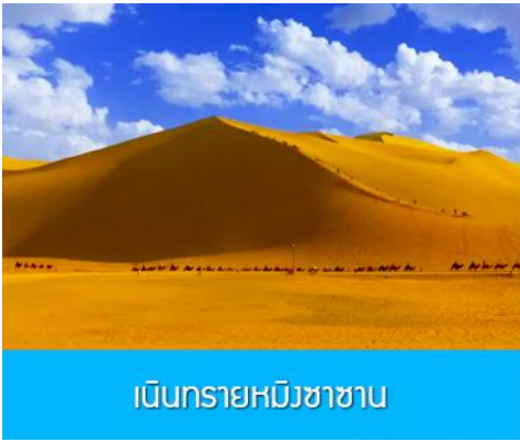
เนินทรายหมิงซาซาน