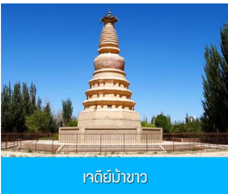
เจดีย์ม้าขาว

เที่ยง รับประทานอาหารกลางวัน ณ ภัตตาคาร (10)