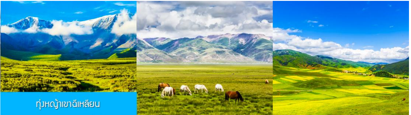
ทุ่งหญ้าฉีเหลียน

จากนั้นนำท่านเดินทางโดยรถบัสสู่ทุ่งหญ้าฉีเหลียน (ระยะทาง 140 กม. ใช้เวลาเดินทางประมาณ 2 ชั่วโมง)