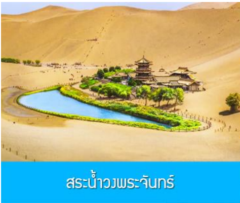
สระน้ำวงพระจันทร์