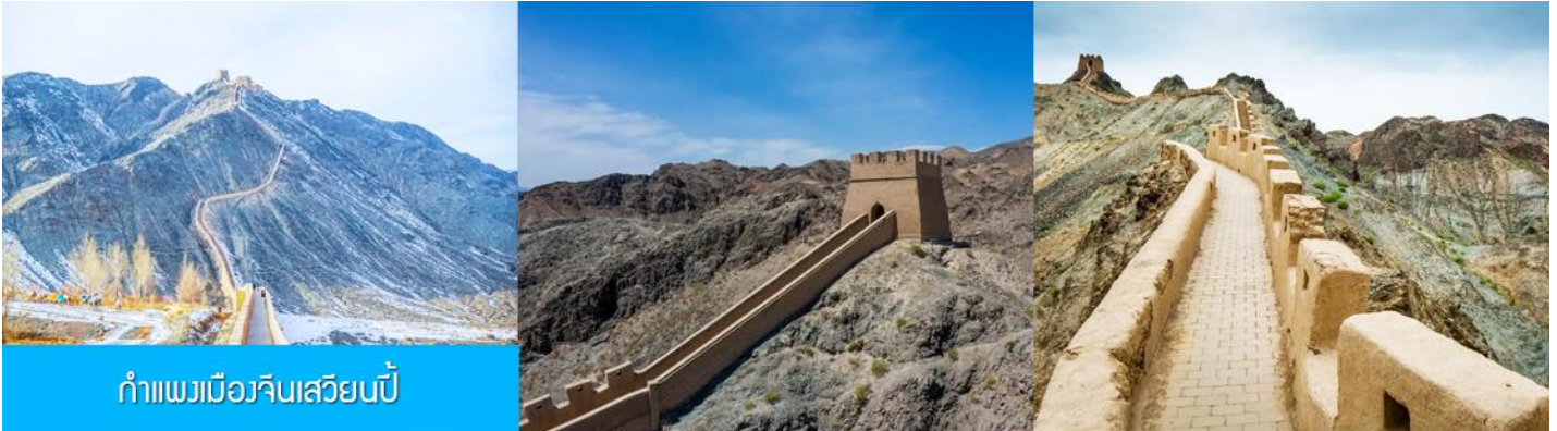
กำแพงเมืองจีนเสวียนปี้