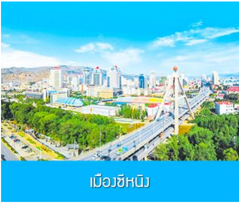
เมืองซีหนิง