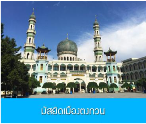
มัสยิดเมืองตงกวน