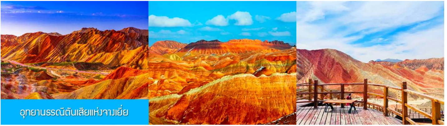
อุทยานธรณีดินสีแห่งจางเยี่ย