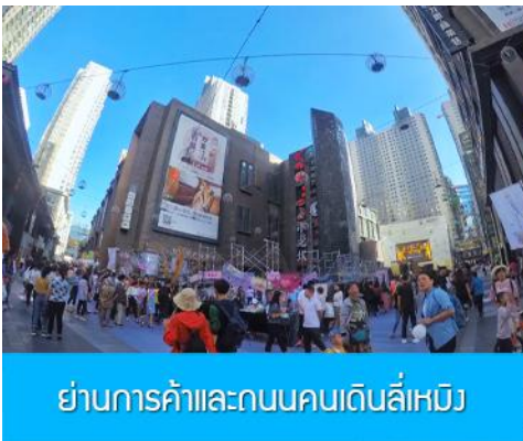
ย่านการค้าและถนนคนเดินลีเหมิง