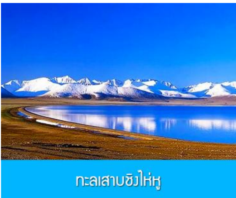
ทะเลสาบชิงไห่ใหญ่

เช้า รับประทานอาหารเช้า ห้องอาหารของโรงแรม (1) หลังอาหารเช้าท่านเดินทางโดยรถบัสสู่ ทะเลสาบชิงไห่ใหญ่ (ระยะทาง 150 กม. ใช้เวลาเดินทางราว 2 ชั่วโมงเศษ)