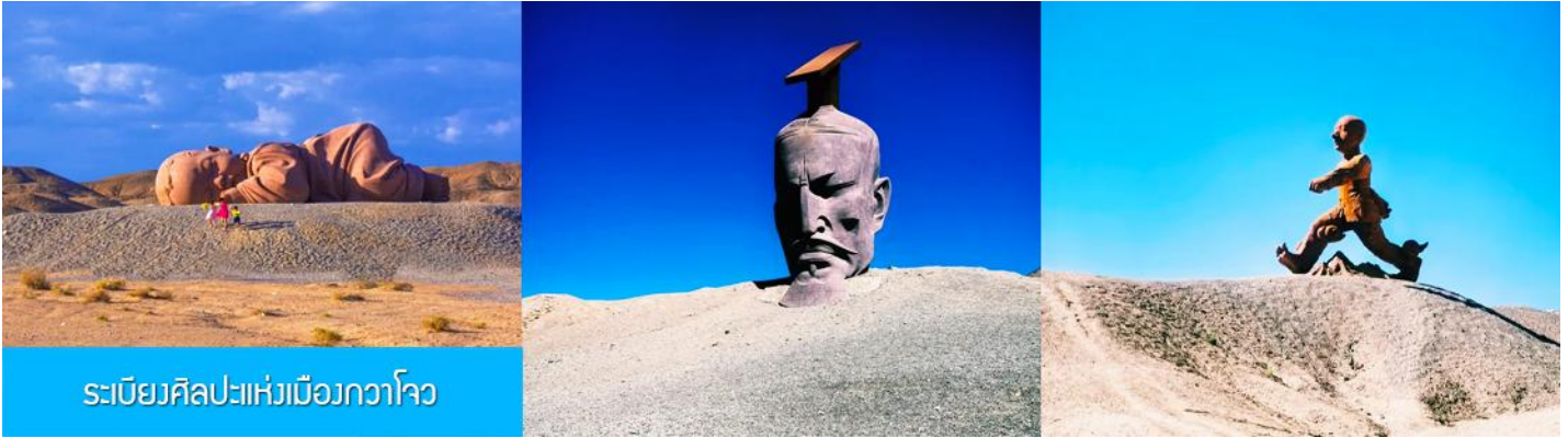
ระเบียบศิลปะแห่งเมืองกวโจว