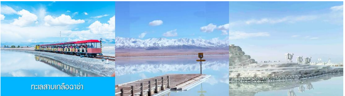
ทะเลสาบเกลือฉาปา

หลังอาหารนำท่านเดินทางโดยรถบัสสู่ทะเลสาบฉาปา (ระยะทาง 289 กม. ใช้เวลาเดินทางราว 3 ชั่วโมงเศษ)