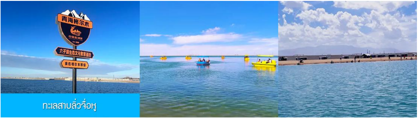
ทะเลสาบลั่วจื่อหู