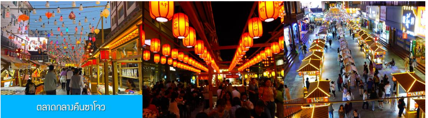
ตลาดกลางคืนซาโจว