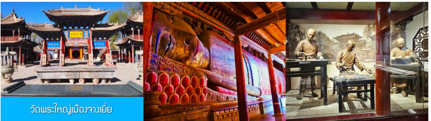
วัดพระใหญ่เมืองจางเยี่ย

เช้า รับประทานอาหารเช้า ณ ห้องอาหารของโรงแรม (15)