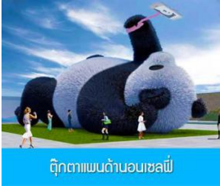
ตุ๊กตาแพนด้าอนเซลฟ์