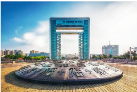
ประตูแห่งโชค

จากนั้น นำท่านเก็บรูปกับ ถนนคอบเพลิงหมายเลข 8 火炬八街 มุมสุดฮิต ที่ต้องมาเก็บรูป เป็นถนนสายเล็ก ๆ ที่ทอดยาวสุดตา เหมือนกับว่าบรรจบกลับเส้นขอบฟ้า เป็นจุดที่นักท่องเที่ยวต้องมาเก็บภาพบรรยากาศ เพราะฮิตที่สุดขอเมืองเวยไห่แล้วตอนนี้ ใ้ให้ท่านได้เก็บภาพ และนั่งจิลคาเฟ่ ตามอัธยาศัย จนได้เวลาอันสมควร นำท่านเดินทางต่อสู่ ประตูแห่งโชค และนี่คือ อีกหนึ่งสัญลักษณ์แห่งเมืองเวยไห่ ประตูสู่ความปรารถนา ณ ริมชายฝั่งทะเลของเมืองเวยไห่ สัญลักษณ์แห่งความหวัง และความสุขของชาวพื้นเมือง ประตูนี้สร้างขึ้นเพื่อฉลองครบรอบ 100 ปี ของการเปิดท่าเรือเวยไห่ จึงขนานนามว่าเป็น ประตูแห่งโชคโลก ที่คอยต้อนรับนักเดินทางทุกท่าน โครงสร้างของประตูที่ตั้งตระหง่านโอบล้อมของท้องทะเลและเกาะหลิวกง อยู่เบื้องหน้า เป็นภาพที่สวยงาม ให้ท่านเก็บบรรยากาศเป็นที่ระลึก จากนั้นเดินทางสู่ภัตตาคาร