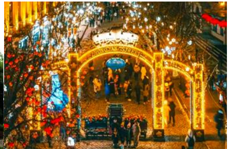
ถนนจางต้าเจีย