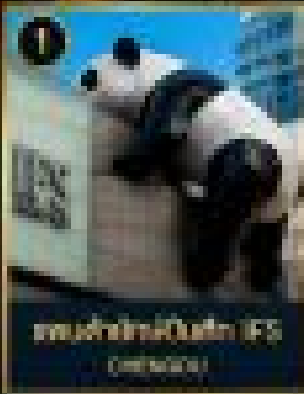
ชมเจ้าแพนด้าในกล่อง (CS) CHONGQING