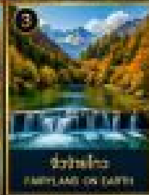
เขื่อนฝางโกว FANGJIANG ON EARTH