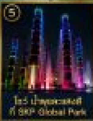
โถงน้ำพุแสงสีที่ BRP Global Park