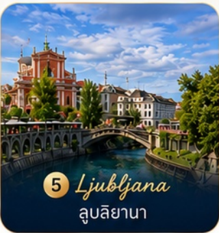
5 Ljubljana ลูบลียานา