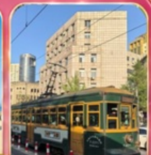
ขั้วรถรางไฟฟ้าชมเมือง