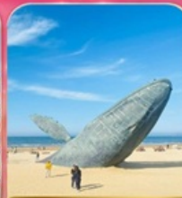
ประติมากรรม "วาฬผู้โดดเดี่ยว"