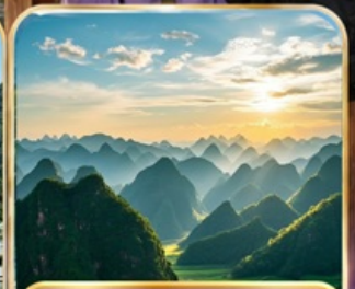
อุทยานป่าภูเขาหมื่นยอด (รวมรถแบตเตอร์รี่ )