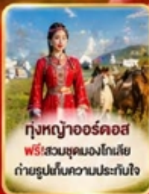
ทุ่งหญ้าออร์ดอส ฟรี! สวมชุดมองโกเลีย ถ่ายรูปเก็บความประทับใจ