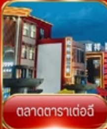
ตลาดตาราเตอ์