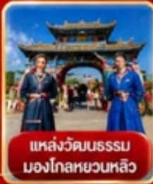
แหล่งวัฒนธรรม มองโกเลียหลวง