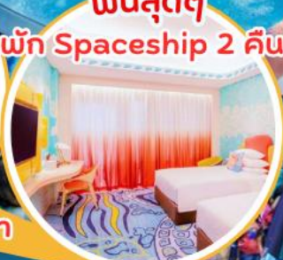
ฟินสุดๆ พัก Spaceship 2 คืน!!