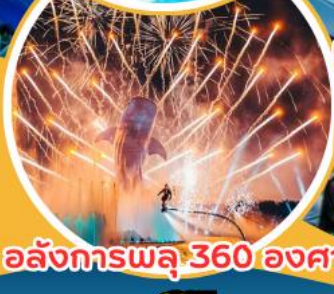
อลังการพลุ 360 องศา