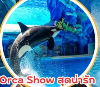
Orca Show สุดน่ารัก