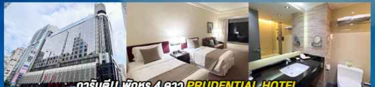
гаринดี!! พักหรู 4 ดาว PRUDENTIAL HOTEL ติดถนนนาธาน ย่านช้อปปิ้งจิมซาจуй