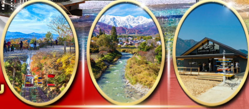
ภูเขา ทาคาโอะ โออิเดะพาร์ค Ao Lakeside Cafe

ปราสาทน้ำสกีไม่ได้ Starbuck Snow Peak Land วัดชินโซจิ