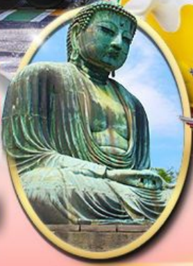
พระใหญ่คามาคุระ