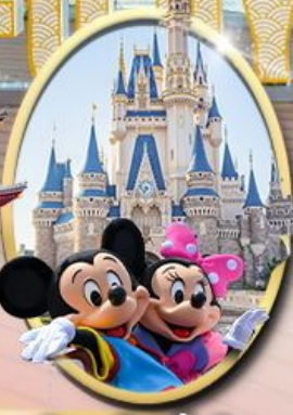
อิสระเลือกซื้อบัตร Tokyo Disneyland