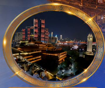
มือค้ำร้านอาหารวิวหลักล้าน ชมแสงสีเมืองลองซิ่ง