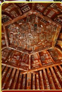
วัดซาชะเอโดะ