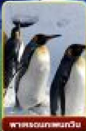
สวนสัตว์ฮอกไกโด