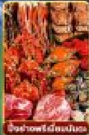
บ่อน้ำพุร้อน