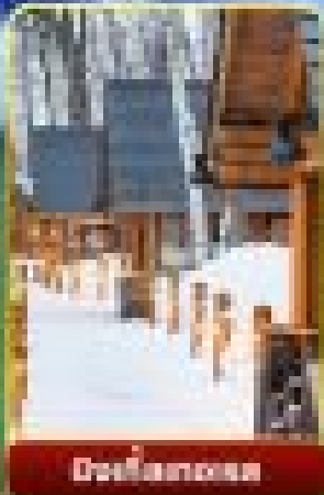
เมืองหิมะ