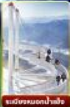
หมู่บ้านน้ำแข็ง