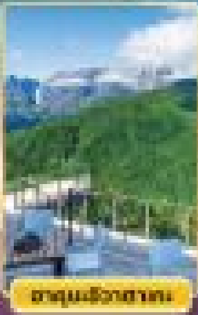
อุทยานฮิวงาฮากะ