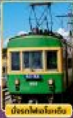
นั่งรถไฟขบวนสีเขียว