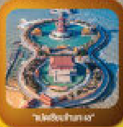
"สวนสาธารณะ"

แหล่งเมืองเก่าเมืองโหล - วัดเซตวัน - พิพิธภัณฑ์ สวนสาธารณะ เมืองโหล - กำแพงโบราณ ลานท่าเรือเก่า - เมืองโหล - พิพิธภัณฑ์เมือง โหล - ถนนสายวัฒนธรรม - สวนสาธารณะ - สวนสาธารณะ - พิพิธภัณฑ์เมือง โหล - สวนสาธารณะ - พิพิธภัณฑ์เมืองโหล - สวนสาธารณะ