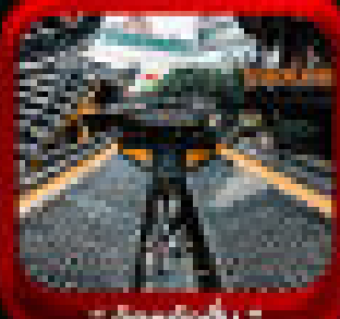
* สตรีทอาร์ต *