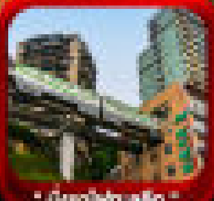
* เมืองฟ้าฮัก *