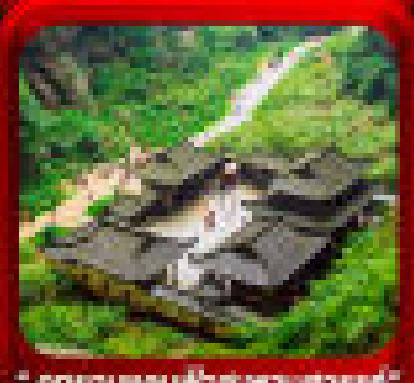
* อุทยานหลุมฟ้าฮัก *