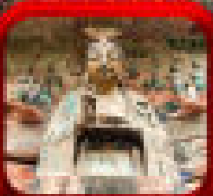
* เขานางฟ้าฮัก *

เมืองแห่งตึกระฟ้า - อุโมงค์ รถไฟความเร็วสูง - เขานางฟ้า - ถ้ำอ้อ - อุทยานหลุมฟ้า - สวนนกฟ้า - เมืองฟ้าฮัก - ศาลาปกครอง (ฟ้าฮัก) - แหล่งเดินช้อปปิ้ง - แหล่งช้อปปิ้ง - สตรีทฟู้ด - สตรีทอาร์ต - ศิลปะ - กิจกรรม - ศูนย์วัฒนธรรมจีน