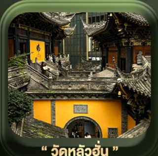
“ วัดหลัวฮั่น ”