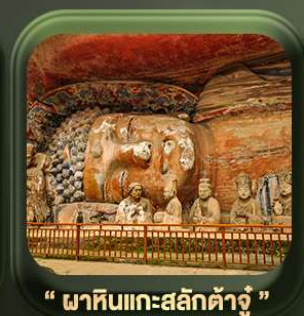
“ ฆาหึบแกะสลักต้าจู้ ”

วันเดินทาง มี.ค. - ต.ค. 2569 ราคาเริ่มต้น 22,999.-