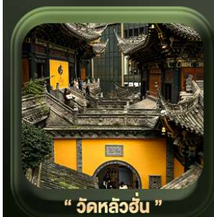
“ วัดหลิวอัน ”