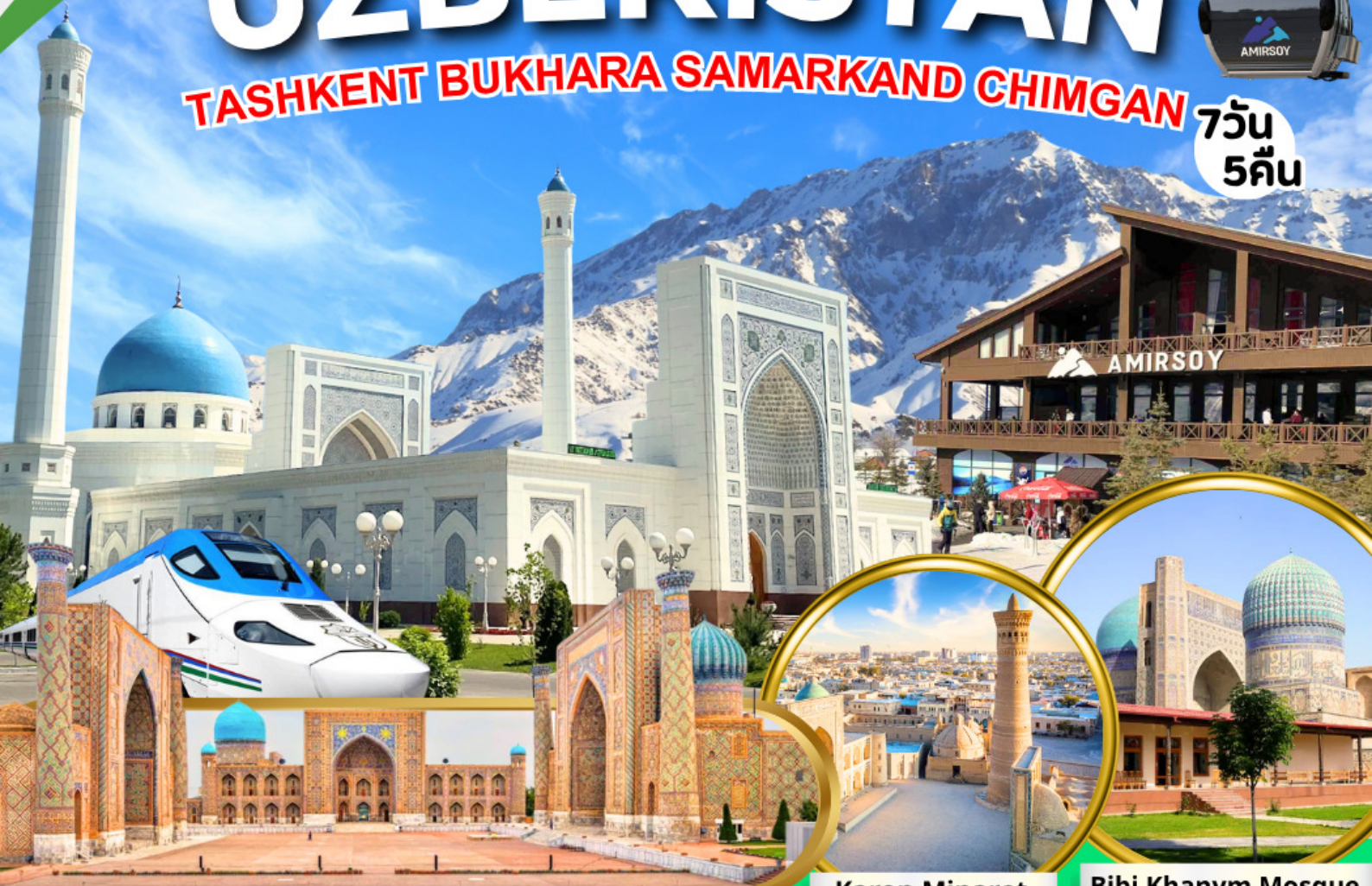
Registan Square | Karon Minaret | Bibi Khanym Mosque