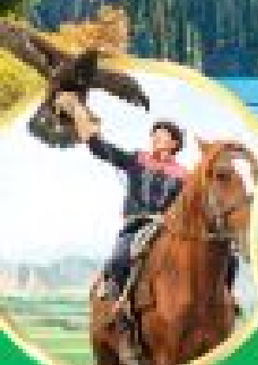
ขี่ม้าชมเมือง