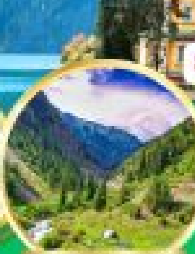
Ala Archa National Park