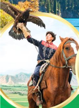
ชมโชว์นกอินทรี