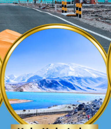
Kala Kule Lake