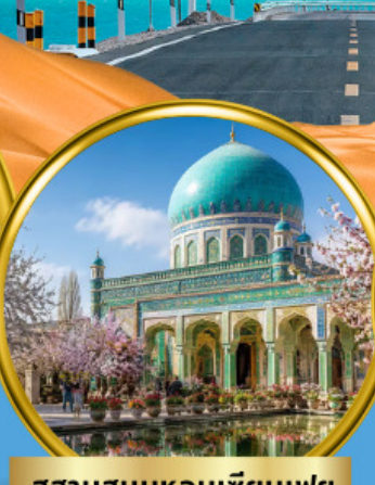
สุสานสมหอมเซียนเฟย