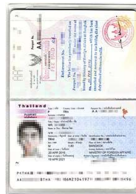
Passport เต็ม 2 หน้า