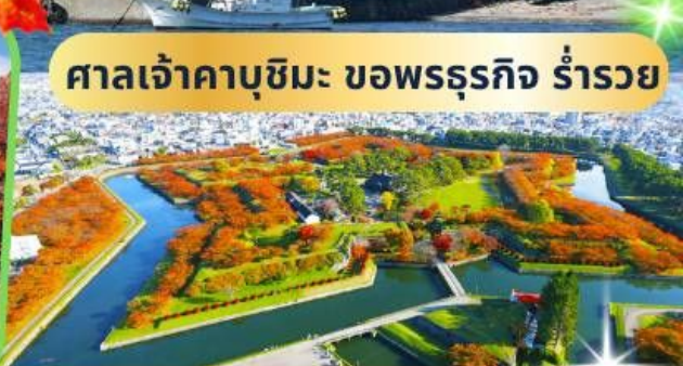
ศาลเจ้าคาบุชิมะ ขอพรรุทกิจ ร่ำรวย