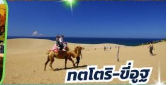
ทตโตริ-ซึจูกู