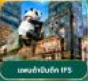
ล่องเรือชมวิวกวนชานี่ Maryu Ma