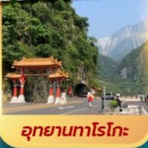
อุทยานทงโรโกะ