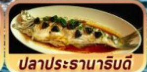
ปลาประจานาริบดี