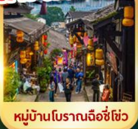
หมู่บ้านโบราณเฉิงชู่ชิว