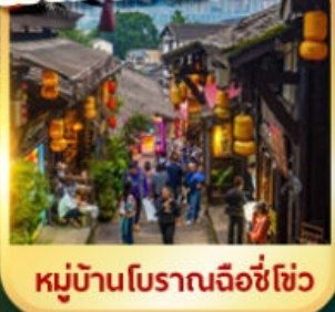
หมู่บ้านโบราณฉือชี่ฮั่ว