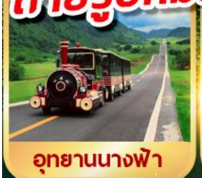
อุทยานนางฟ้า