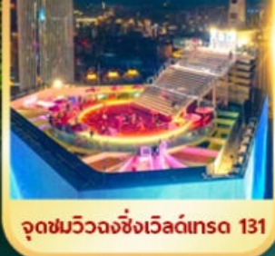
จุดชมวิวฉงชิ่งเวสต์เทรด 131