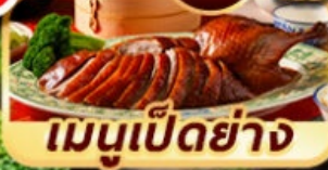
เมนูเปิดย่าง