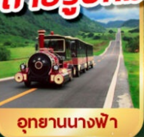
อุทยานนางฟ้า