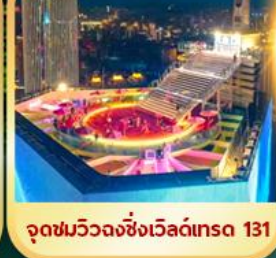
จุดชมวิวจางชิ่งเวิลด์เทรด 131