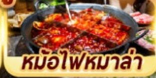
หม้อไฟหมาล่า