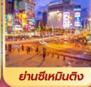
ย่านซีเหมินต้ง