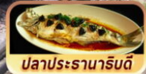
ปลาประจานาริบดี