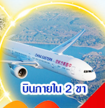
บินภายใน 2 ชม