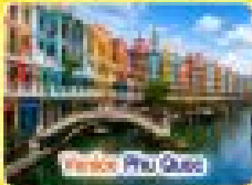
Venice Phu Quoc