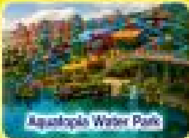
Aquaplus Water Park