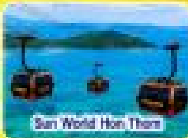
Sun World Hon Thom