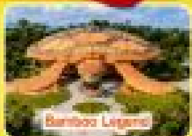
Binh Ba Legend