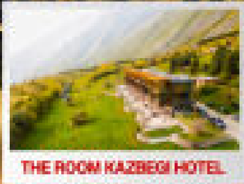
THE ROOM KAZBEGI HOTEL