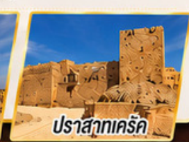
ปราสาทเคิร์ค