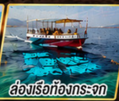
ล่องเรือท้องกระจก