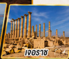
เจอร์ราช