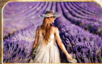
ทุ่งดอกลาเวนเดอร์