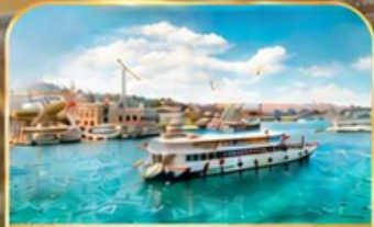
ล่องเรือ BOSPHORUS