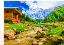
ยอดเขานังกาพาร์บัต

** พักที่ Raikot Sarai Hotel หรือเทียบเท่า **