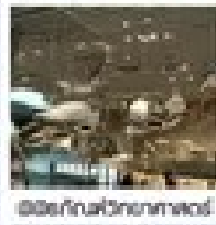
เมืองโบราณอูเจิน