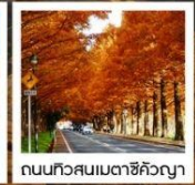
ถนนทิวสนเมตาชิคังญา